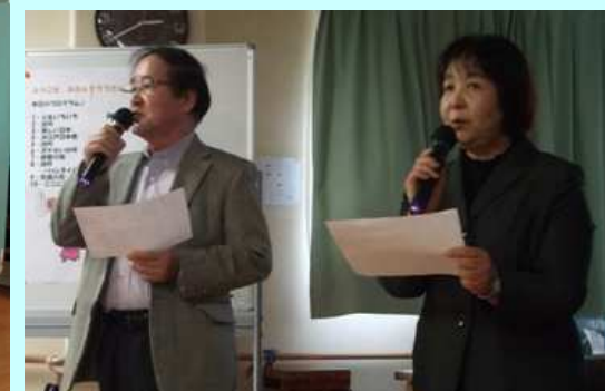
いつもありがとうございます