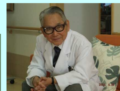
香田先生もうっとり・・・